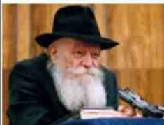
Любавичский Ребе שליט א"י Король Мошиах:

СБП, ДНИ МОШИАХА! 20 НИСАНА 5780 ГОДА, ТРЕТИЙ ДЕНЬ НЕДЕЛИ